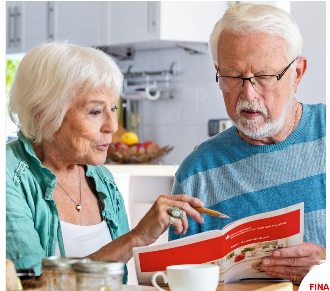
Bild: Geld und Haushalt